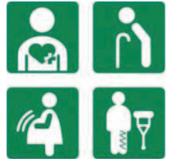
ゆずりあい駐車区画