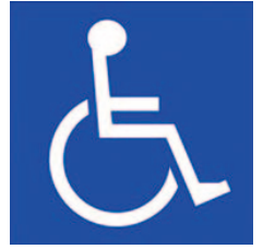
車いす使用者用駐車区画

公共施設や商業施設などにおいて、出入口近くに設けられた幅の広い「車いす使用者用駐車区画」や車いす使用者以外の移動に配慮が必要な方のための「ゆずりあい駐車区画」を一般の人が利用し、真に必要とする人が利用できなくなる事例がたびたび見受けられます。障がい者や高齢者、妊産婦など移動に配慮を要する方々が安心して外出できるよう、ゆずりあいの心で駐車スペースの適正利用にご理解、ご協力をお願いします。