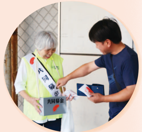
▲昨年の街頭募金の様子